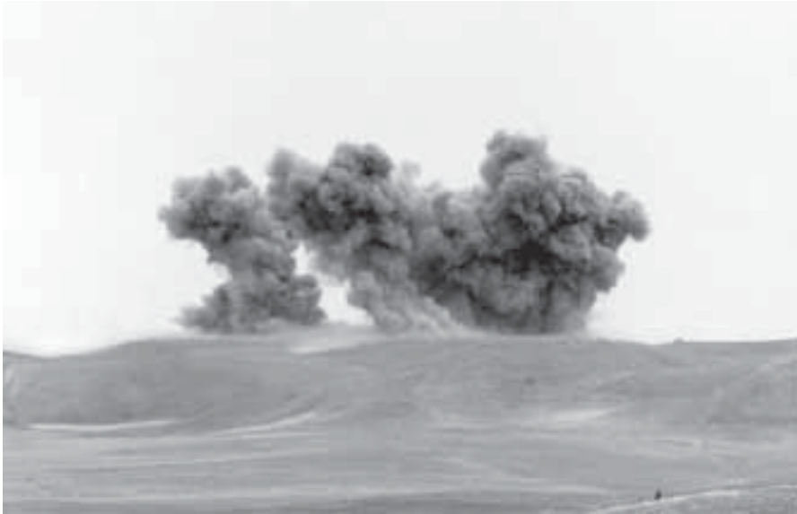
Damm och rök stiger upp från Kalakata-höjden, nära byn Ai Khanoum i norra Afghanistan. Det är USA som bombar en talibanställning med B 52-plan. Reuters 1 november 2011.